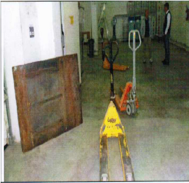
N 10 TRANSPALLET MANUALI