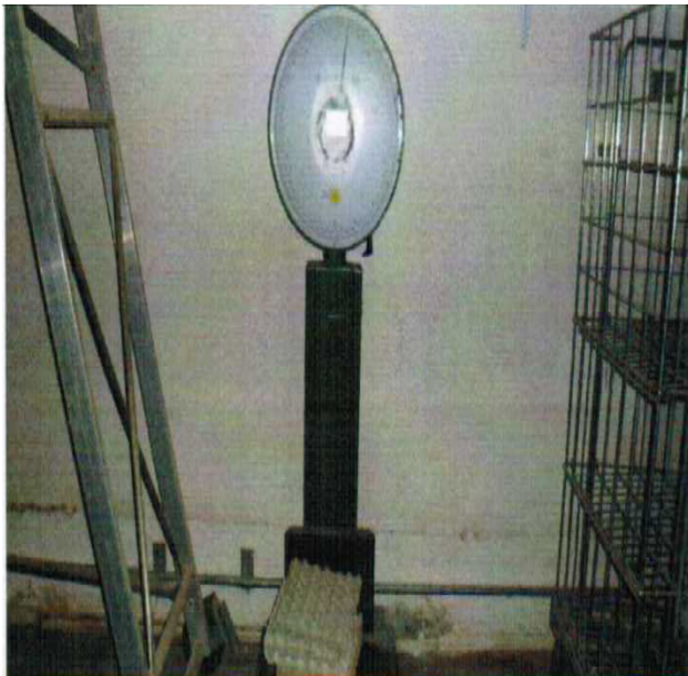
N 12 BILANCIA SANTOSTEFANO