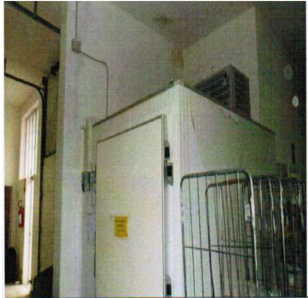
N 11 CELLA FRIGO