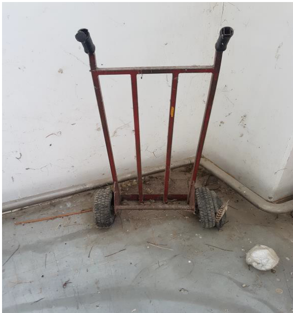
N. 13 CARRELLO IN FERRO PORTA COLLI