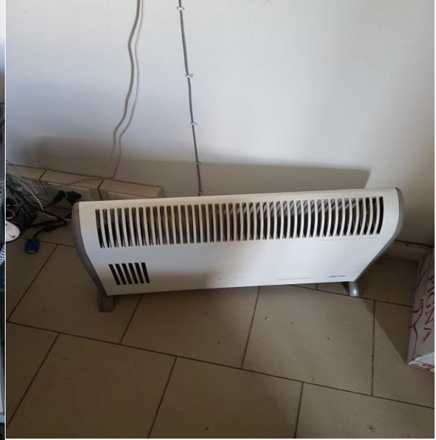
N. 5 STUFA ELETTRICA IMETEC