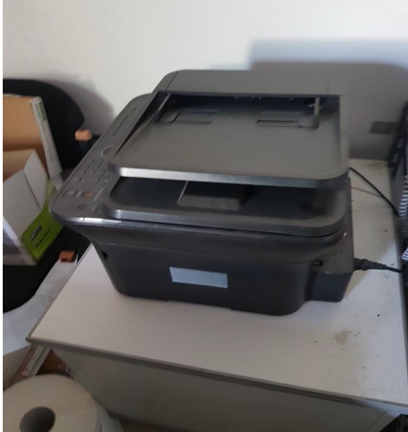
N. 4 STAMPANTE MULTIFUNZIONALE SAMSUNG