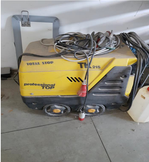
N. 15 IDROPULTRICE FAIP