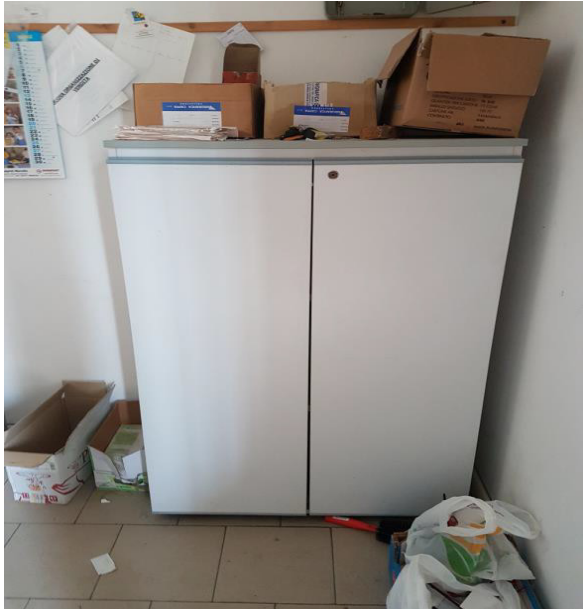
N. 6 ARMADIO LAMINATO A DUE ANTE