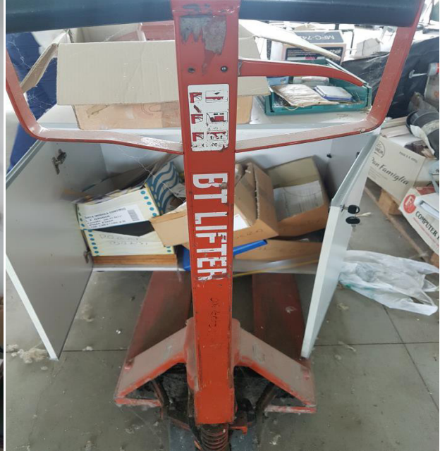
N. 12 TRANSPALLET MANUALE