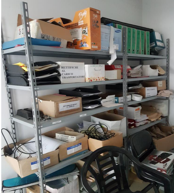
N. 11 SCAFFALATURA METALLICA